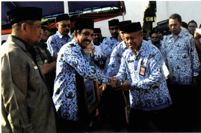
Sekda Serahkan Sertifikat Adipura Ke Bupati Takalar