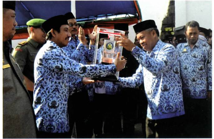
Sekda Serahkan Piala Swasti Saba padapa Ke Bupati Takalar