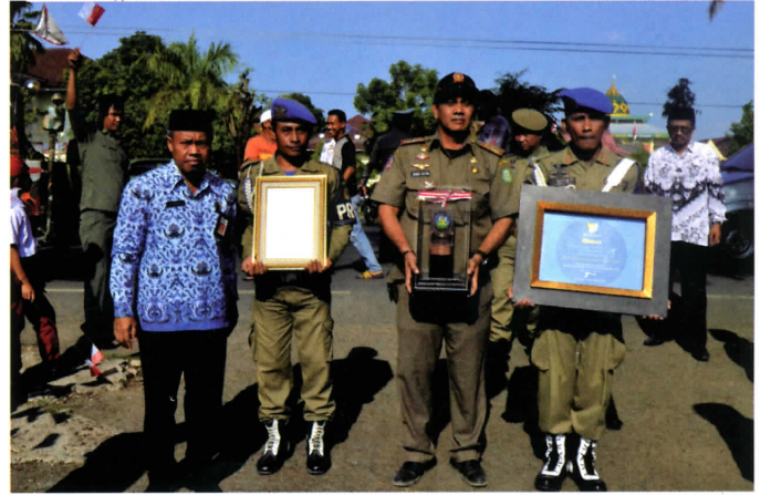
Sekda Takalar Saat Tiba Membawa Penghargaan di Sambut Dengan Meriah