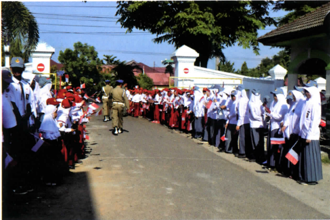
Suasana Penyambutan Sertifikat Adipura & Swasti Saba Padapa Di Kantor Bupati Takalar