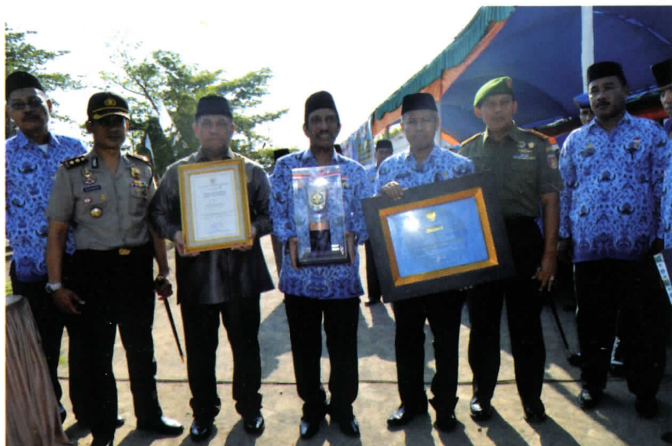
Bupati, Sekda, Ketua DPRD, Kapolres & Dandim Foto Bersama