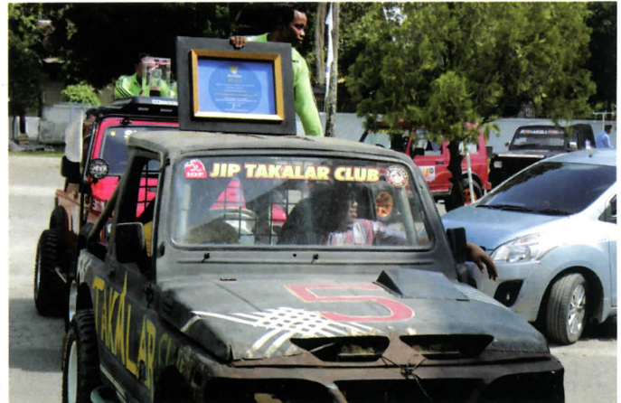
Sertifikat Adipura & Swasti Saba Padapa Diarak Keliling Kota Kabupaten Takalar